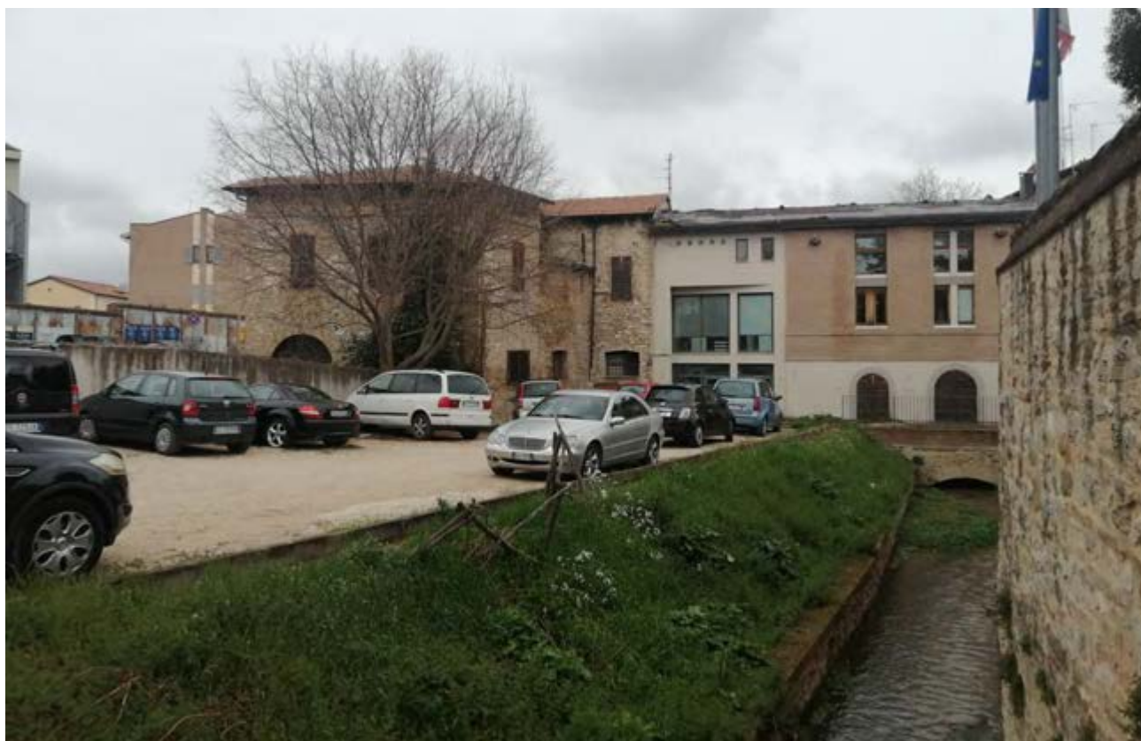
FOTO 52/53: viste del canale interne al parcheggio Via dei Molini e muro di confine