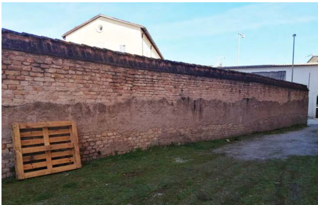
FOTO 33: muro di confine parcheggio Ostello Pierantoni/Multisala Politeama Clarici