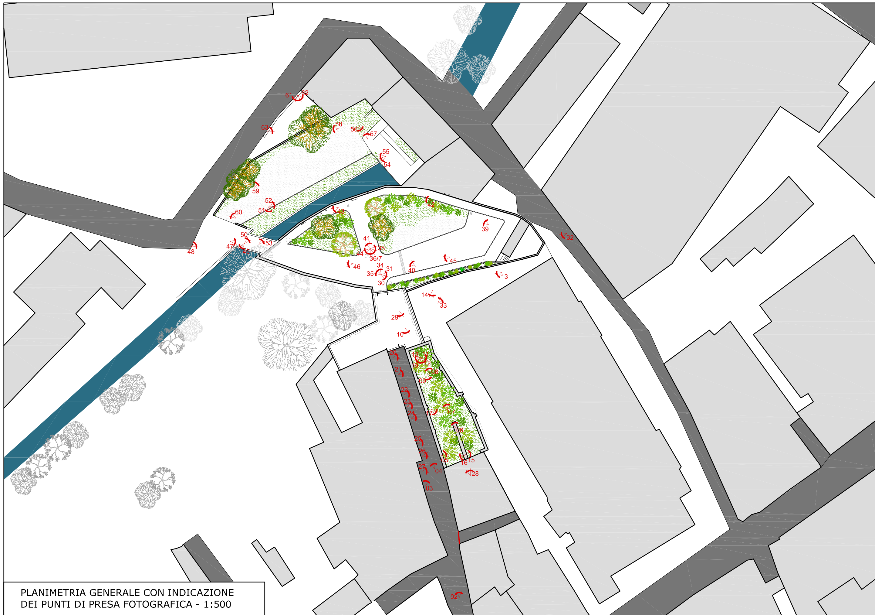
PLANIMETRIA GENERALE CON INDICAZIONE DEI PUNTI DI PRESA FOTOGRAFICA - 1:500