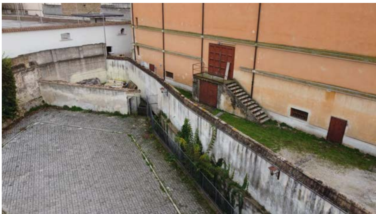
FOTO 30/31: muro di confine parcheggio Ostello Pierantoni / Multisala Politeama Clarici