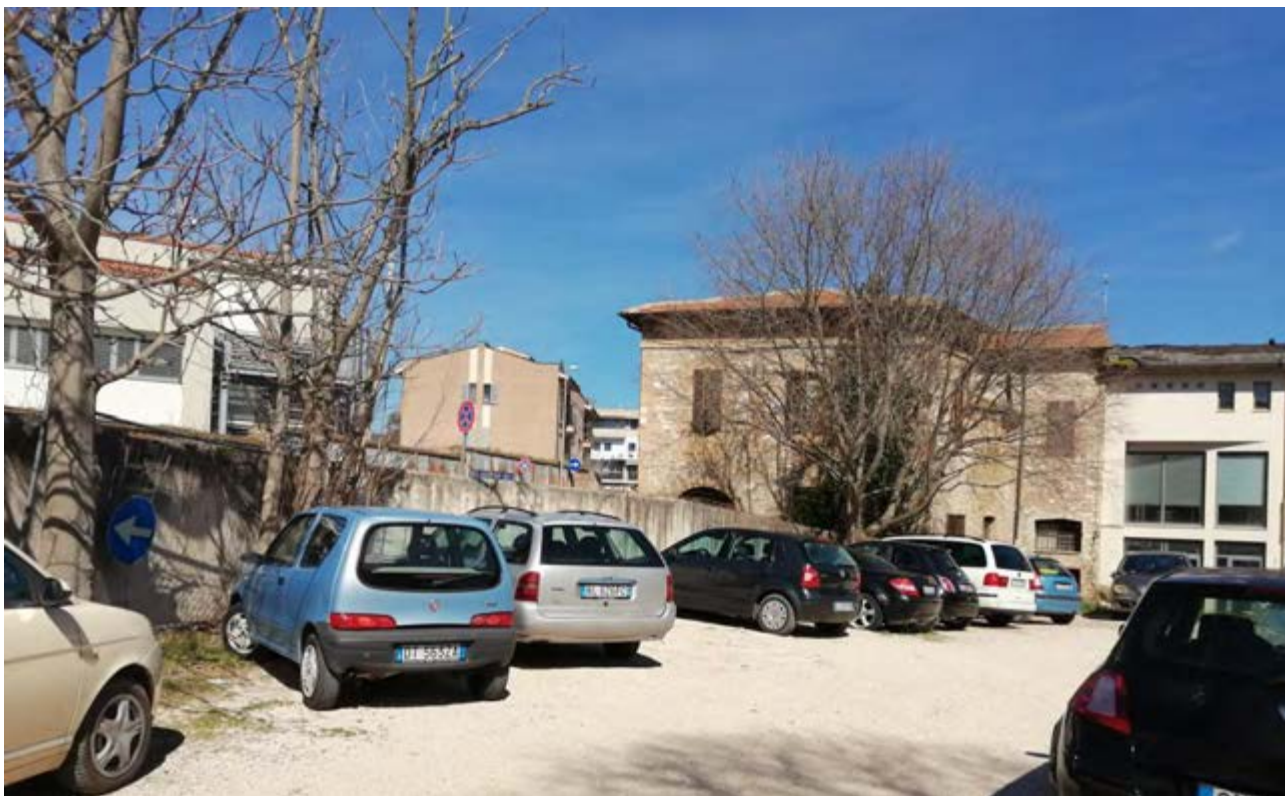
FOTO 58/59: parcheggio Via dei Molini – muro di confine con la strada