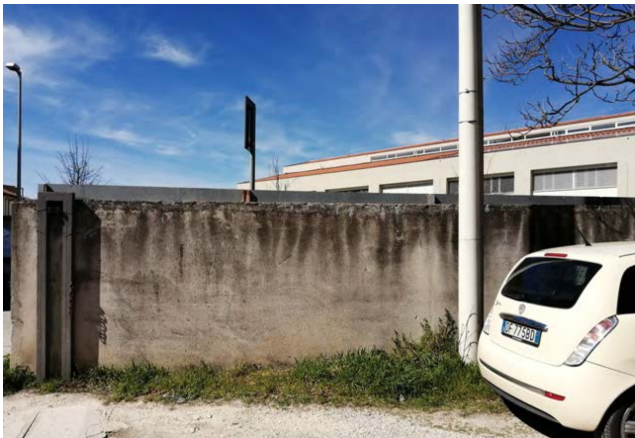
FOTO 60: parcheggio Via dei Molini – ingresso e muro di confine con la strada