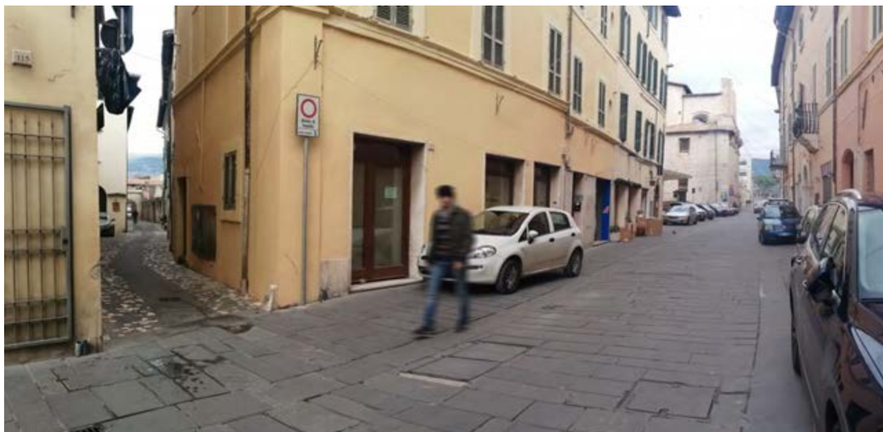
FOTO 01: Via Garibaldi- Via dei Molini – relazione con ex chiesa della SS.Trinità in Annunziata