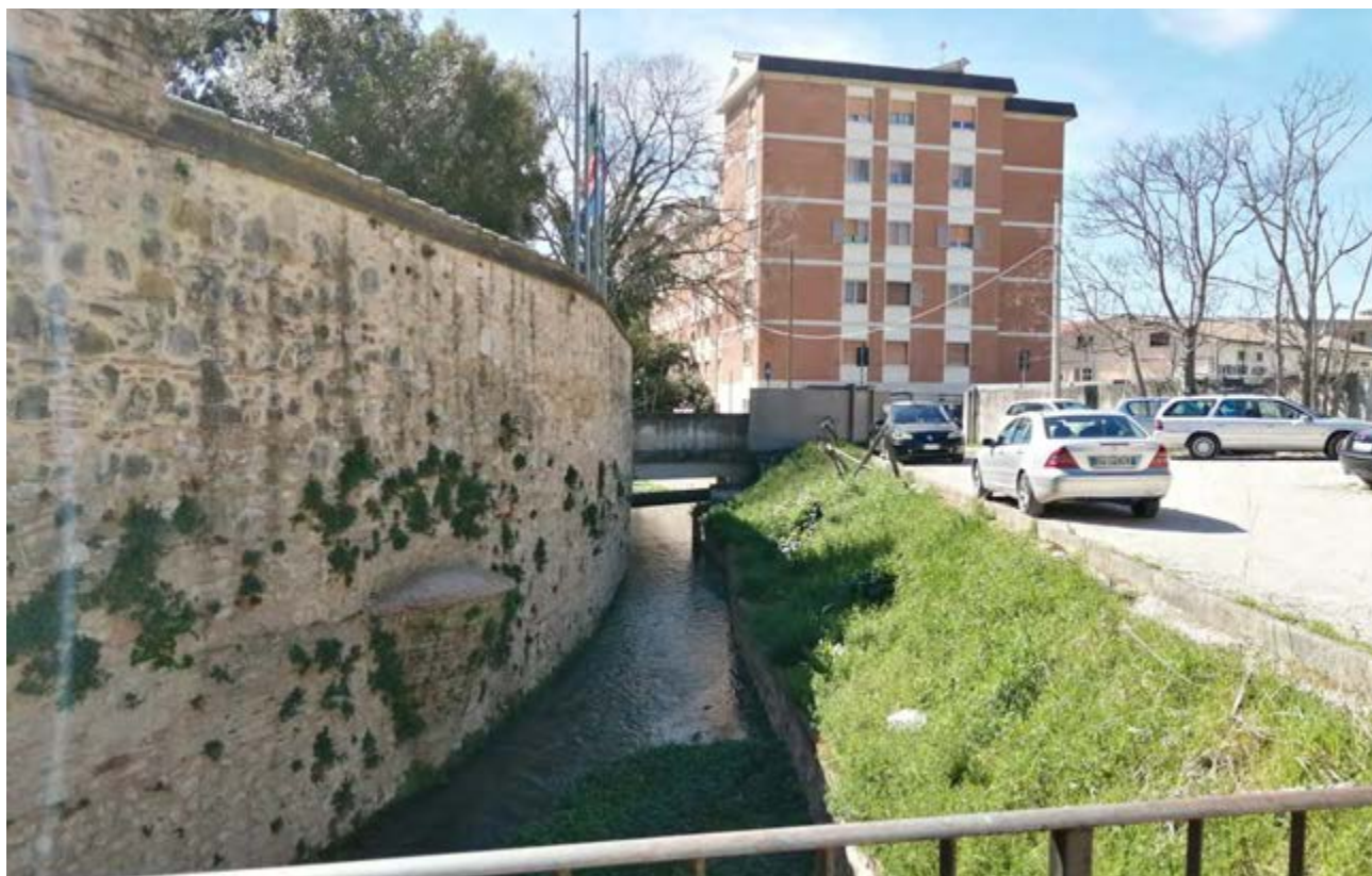
FOTO 54: Vista del canale interna al parcheggio Via dei Molini e muro di confine