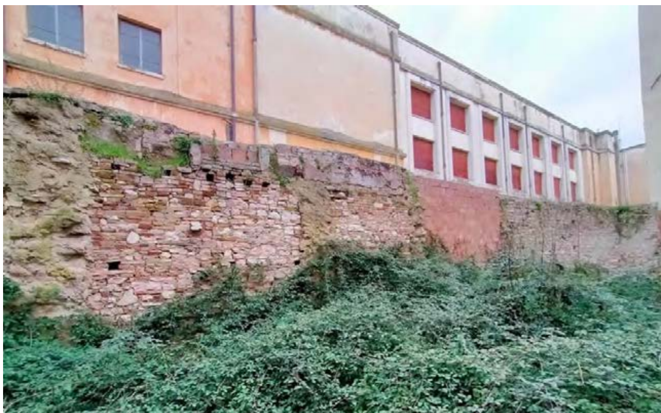
FOTO 11/12: viste interne – muro di confine con Multisala Politeama Clarici