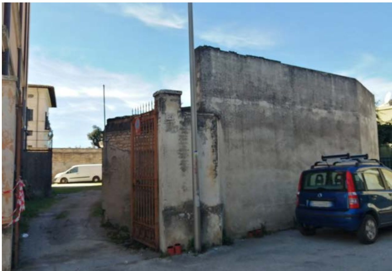
FOTO 32: muro di confine su Via dei Molini – ingresso retro Multisala Politeama Clarici