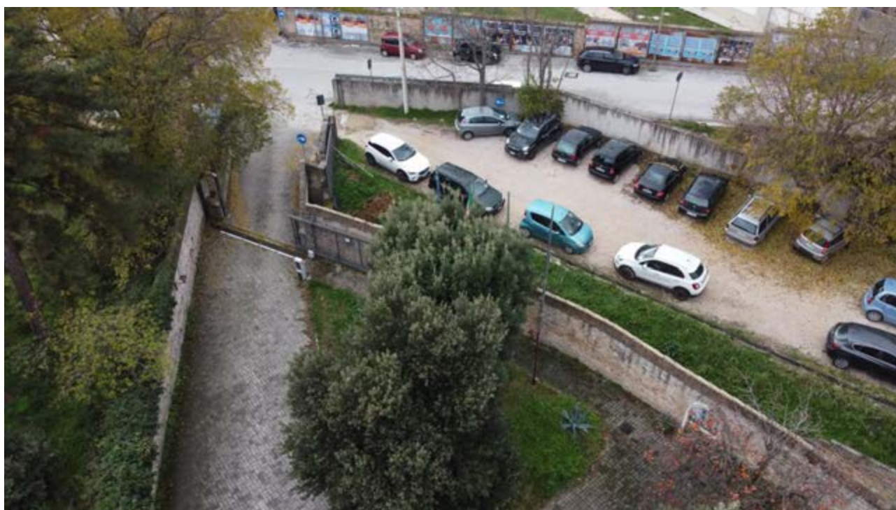
FOTO 34/35: viste dall'alto parcheggio Ostello Pierantoni e parcheggio via dei Molini