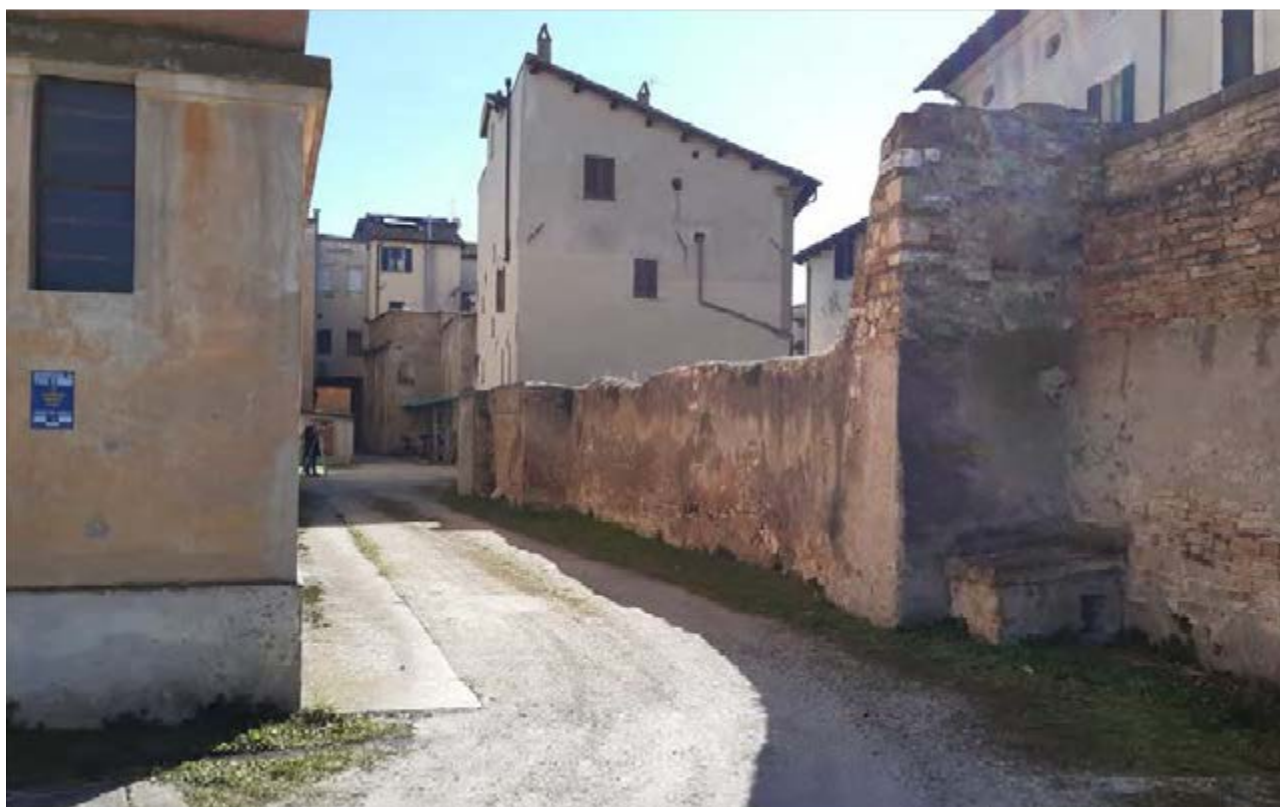
FOTO 13/14: viste esterne - muro di confine con Multisala Politeama Clarici